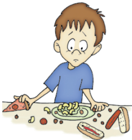
Dieta autolimitante intensa y/o sensibilidad a los alimentos